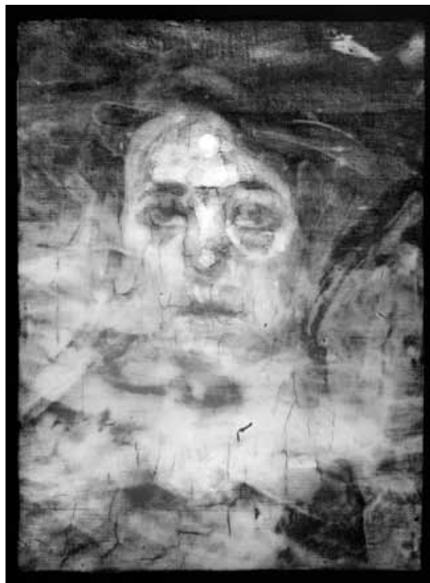
11 RTG slike Portret žene s kravatom X-ray of the painting Woman with a Tie

New IR reflectographs of Račić's painting, details ( Portrait of Woman with Hat , 1907, Modern Gallery Zagreb; Old Man , 1906/1907, National Museum, Belgrade; Portrait of Schülein , 1908, National Museum Belgrade; Portrait of Pepica , 1907, Modern Gallery Zagreb)