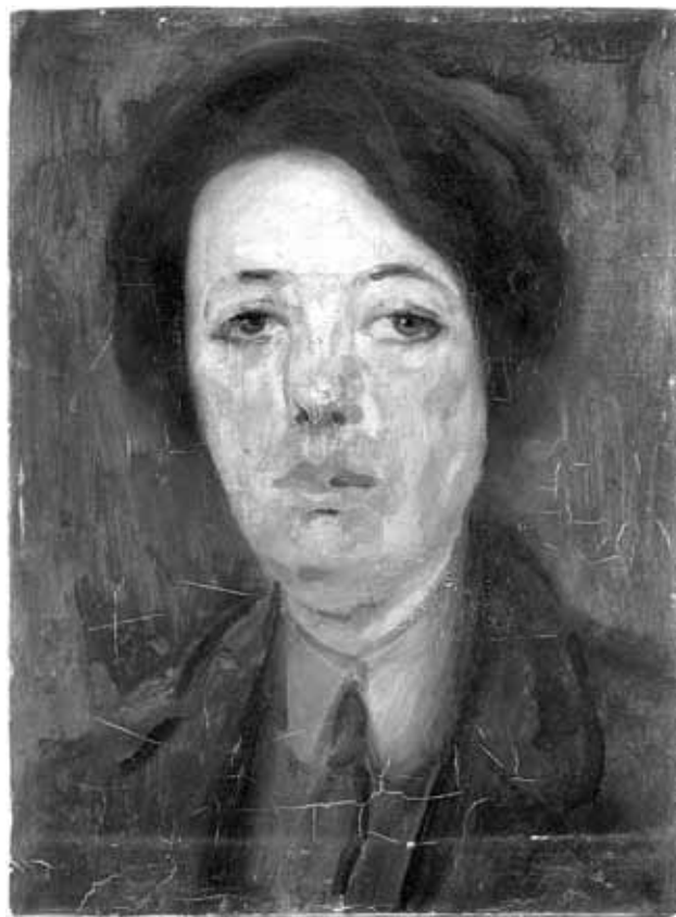
9 IR reflektografija slike Portret žene s kravatom na 1 000 nm IR reflectography of the painting Woman with a Tie at 1000 nm

su to bile strukturne metode istraživanja (IRR, UVR, UVF i RTG) 19 i jednom analitičke metode (XRF, FT-IR i TLC) 20 .