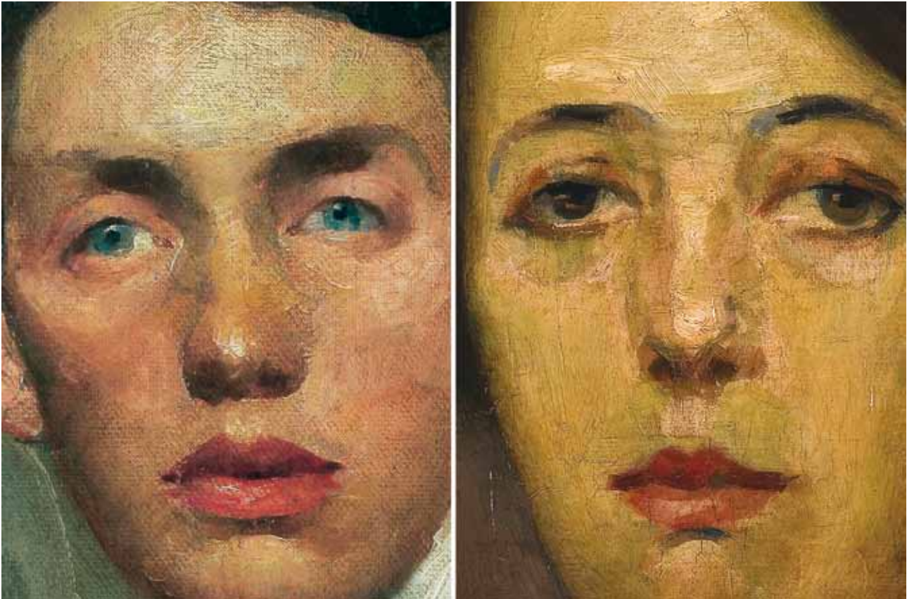
3 Komparacija detalja dviju slika: Autoportret iz 1906. i Portret žene s kravatom Comparison of details from the two paintings: Self-portrait from 1906 and Portrait of a Woman with a Tie