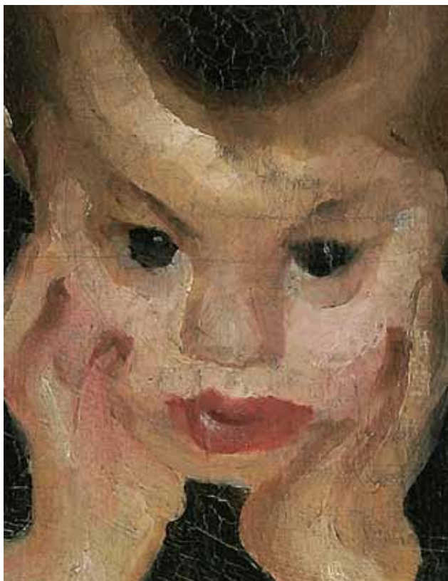
4 Detalj slike Majka i dijete iz Moderne galerije Detail from the painting Mother and Child from the Modern Gallery