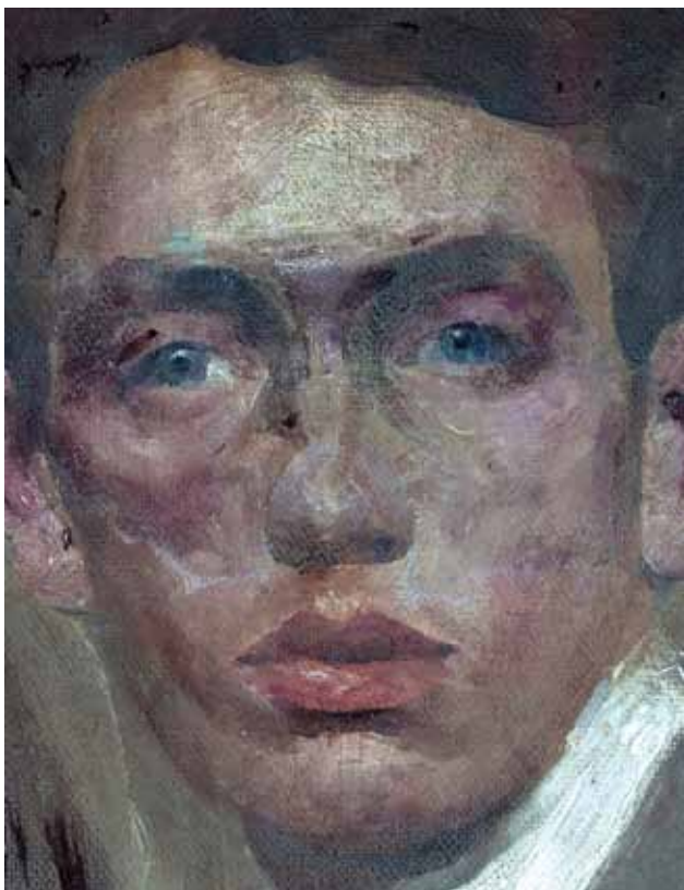
6 UV fluorescencija detalja Račićeva autoportreta iz 1906. UV fluorescence of a detail from Račić's self-portrait from 1906.