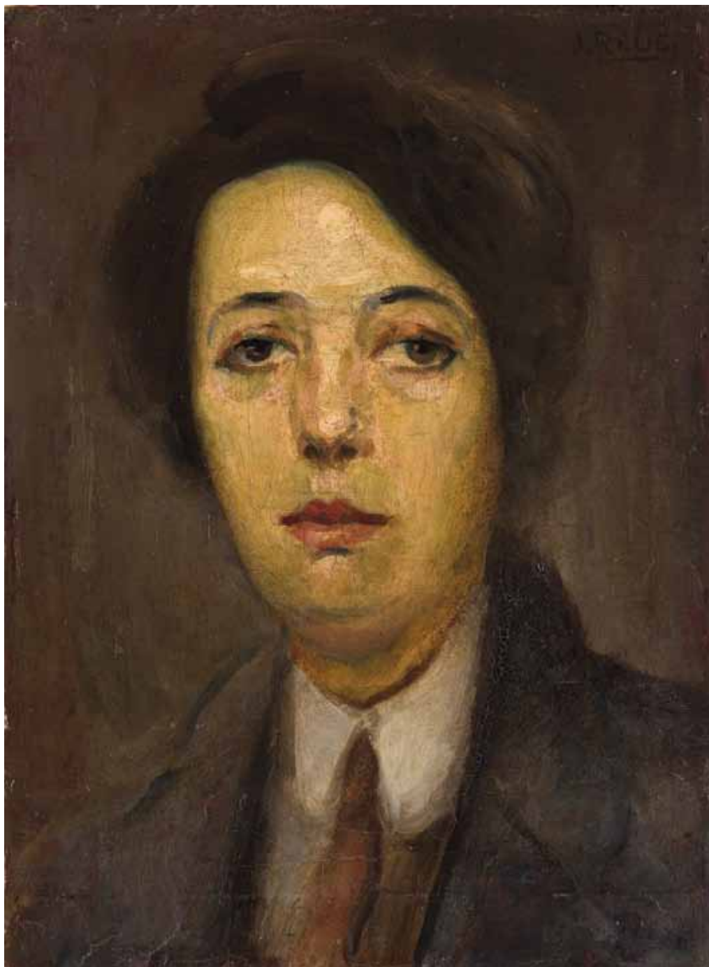
13 Portret žene s kravatom nakon konzervatorsko-restauratorskih radova Portrait of Woman with Tie after treatment.

olovna bijela ( 2\text{PbCO}_3 \cdot \text{Pb(OH)}_2 ) s cinkovom bijelom ( \text{ZnO} ). U tamno plavom dokazana je kobaltna plava ( \text{CoAl}_2\text{O}_4 ), cinober ( \text{HgS} ) te možda i prusko plava ( \text{Fe}_4(\text{Fe}[\text{CN}]_6)_3 ). Dokazano željezo možda potječe i od željeznog oksida u slojevima ispod. Kao crveni pigment dokazan je cinober. Za tamno zeleni pigment teško je na osnovi ove analize reći o čemu je riječ. Tu je detektirano malo kroma, možda od kromne zelene, ili cinober zelene (engleska zelena) ( (\text{Fe}_4(\text{Fe}[\text{CN}]_6)_3 + \text{PbCrO}_4) ). U crvenome sloju podloge uz olovnu i cinkovu bijelu prisutan je cinober i željezni oksid. U ljubičastome sloju dokazan je cinober s nešto bakra najvjerojatnije od azurita ( 2\text{CuCO}_3 \cdot \text{Cu(OH)}_2 ).