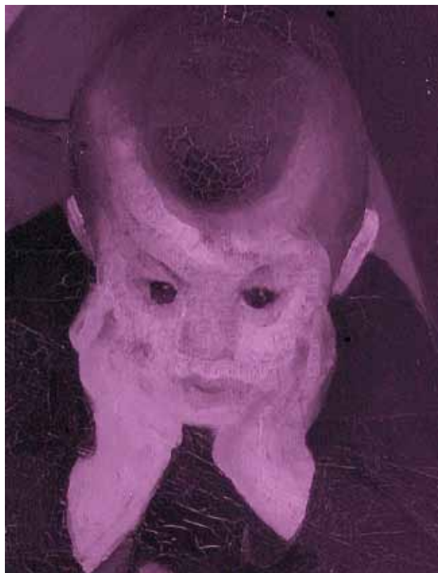
5 IR reflektografija na 720 nm detalja slike Majka i dijete IR reflectography at 720 nm of a detail of the painting Mother and Child

fizičku i psihičku nazočnost (kako je već izvrsno zapaženo: ni u jednom se njegovu portretu ne događa ništa osim teške samoće bića 13 ). Sve je u toj funkciji; impostacija, raspored svjetla, šturo modeliranje, vrlo bliska linija pogleda između promatrača i portreta, a ponajviše oči portretirane. Njezina samosvijest, vidljiva u izravnom pogledu, istaknuta i nošenjem kravate, tek je vanjska manifestacija sjete i rezignacije, ali s mnogo unutarnje napetosti (ponovno: Vrhunac je izražajnosti njegovih lica u odsutnosti svake ekspresije. Nema izražene emocije, (...). Likovi gledaju u stranu ili, pak, izravno kroz nas 14 ), koja je apsolutno glavna karakterizacija modela.