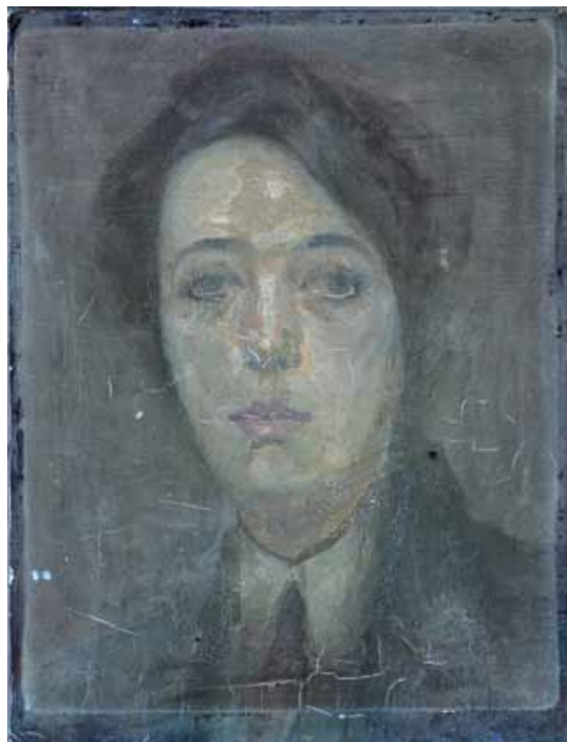
7 UV fluorescencija slike Portret žene s kravatom na 365 nm UV fluorescence of the painting Woman with a Tie prior at 365 nm

vidljivo i golim okom 15 , a napose je vidljivo s pomoću UV fluorescencije 16 (sl. 6, 7).