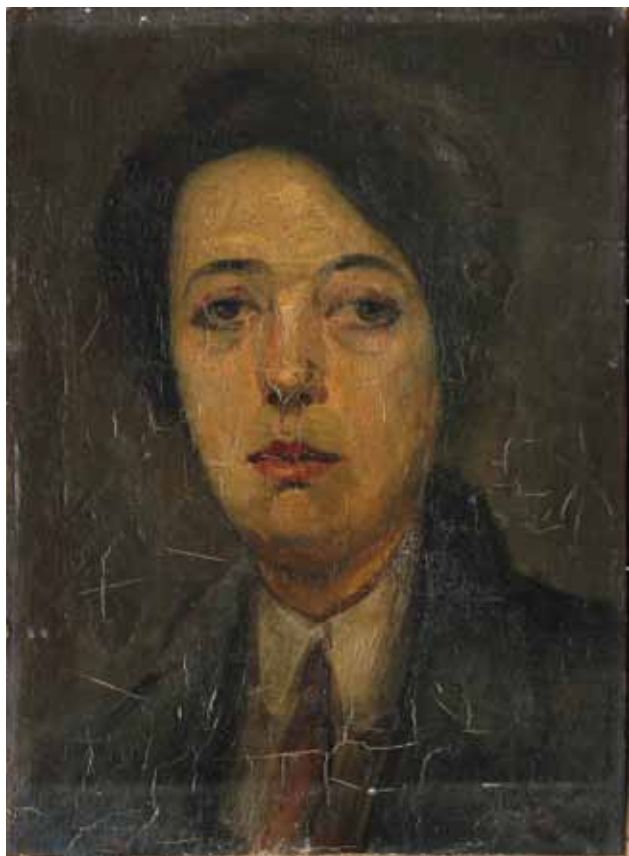
1 Zatečeno stanje slike Portret žene s kravatom Portrait of a Woman with a Tie prior to restoration