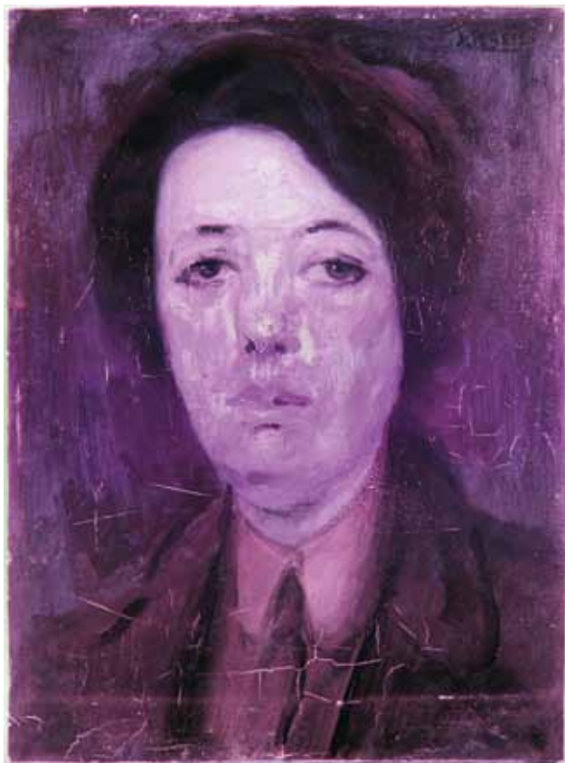
8 IR reflektografija slike Portret žene s kravatom na 720 nm IR reflectography of the painting Woman with a Tie at 720 nm