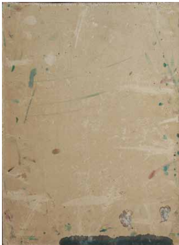
2 Poledina slike Back of the painting

Dakako, u pokušaju utvrđivanja autentičnosti predmetne slike poslužiti ćemo se provjerenom i neizbježnom komparativnom metodom. Pažljiva usporedba niza slika na kojima uočavamo karakterističnu poetiku (slikarsku morfologiju) i rukopis Josipa Račića; kako u cjelini ovoga djela, tako i u njenim brojnim pojedinostima, osnova je analize i na njoj zasnovano donošenje zaključaka. Međutim, ta specifična konoserska metoda koja se nužno oslanja na vizualni materijal i jedino se zornim upućivanjem na bitne odlike i specifičnosti djela može dosljedno i uvjerljivo provesti, evoluirala je od svoje, nazovimo je tako, 'tradicionalne' epohe u kojoj Max Friedlander, jedan od glavnih predstavnika, ističe kako se: „sigurnost (u prosudbi atribucije, nap. aut.) može postići jedino na temelju dojma cjeline; nikad na analizi vidljivih oblika“. 7 Takvo oslanjanje na intuiciju kao izraz krajnje subjektivnosti, zamijenjeno je – barem u slučajevima kada je takvo istraživanje provedeno – pristupom koji nastoji biti objektivnije utemeljen „na analizi različitih slikarskih postupaka (u njihovim vrlo raznolikim formama) koji su primjenjivani da bi se stvorila uvjerljiva